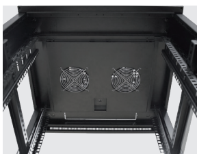
Imagen 4 / Picture 4

Instalación en parte superior Installation at the top