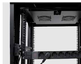
Imagen 6 / Picture 6

Funcionamiento (modo continuo) Operation (continuous mode)