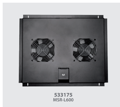
Imagen 2 / Picture 2