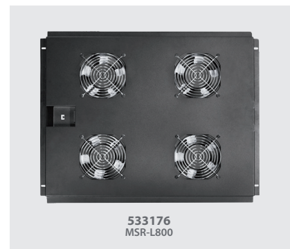
Imagen 3 / Picture 3