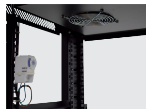
Imagen 7 / Picture 7

Funcionamiento (bajo termostato) Operation (with thermostat)