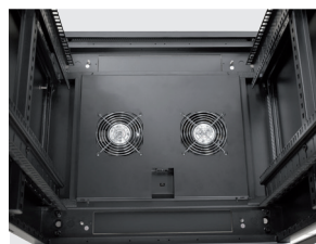
Imagen 5 / Picture 5

Instalación en parte inferior (voltar ventiladores 180°) Installation at the bottom (Rotate fans 180°)