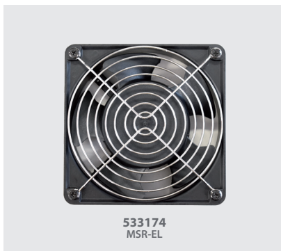
Imagen 1 / Picture 1