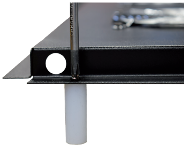
Imagen 8 / Picture 8