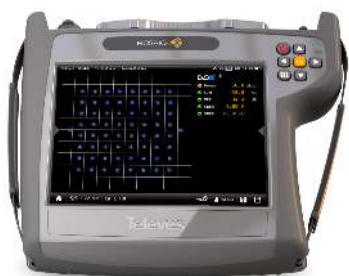
Diagram konstelacji jest niezbędny w wykrywaniu obecności szumu, fluktuacji fazy, zakłóceń i innych problemów, które mogą wpłynąć na jakość sygnału zmniejszając MER.

Graficzna projekcja echa pozwala na zidentyfikowanie obecności echa w odbiorze sygnału naziemnego DVB-T/ T2, co oznacza, że pomiar BER może zostać znacznie obniżony.