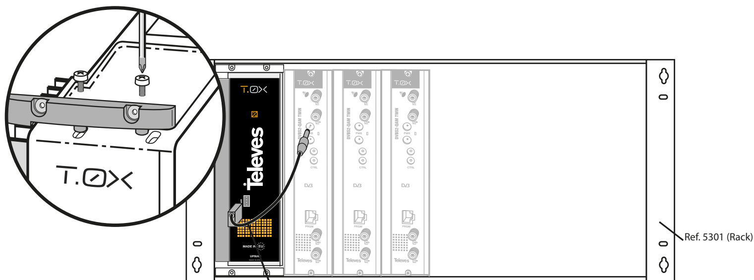
Latiguillo para Alimentación de módulos T.0X